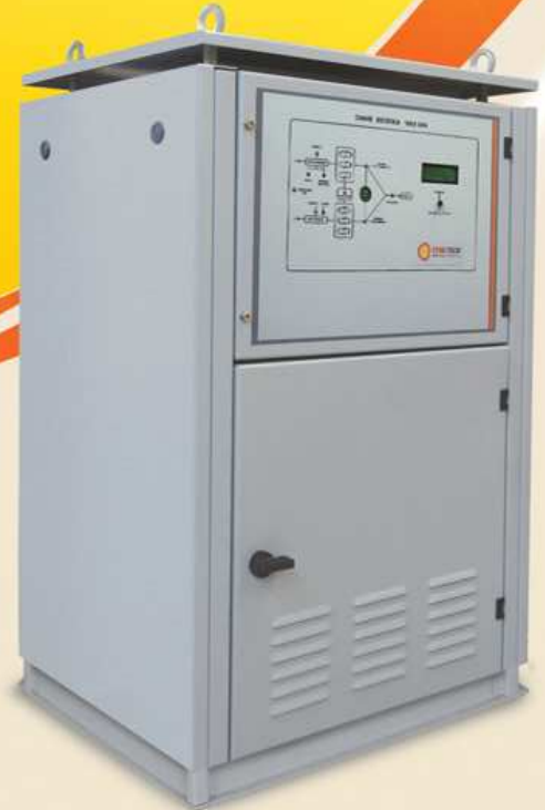
Montagem em gabinete auto-sustentado

As Chaves Estáticas de Transferência CSE, da CTRLTECH são destinadas a alimentação de cargas críticas. Seu controle microprocessado avalia entre duas fontes de alimentação, qual deve alimentar a carga, seguindo em princípio uma prioridade pré-definida, ou seja, em caso de falha da fonte definida como Principal, o controle transfere a alimentação da carga para a outra fonte, chamada de Alternativa, automaticamente e sem interrupção.