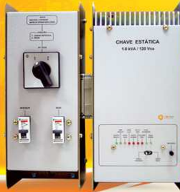
Modelo fundo de painel com módulo bypass independente, Hot plug-in