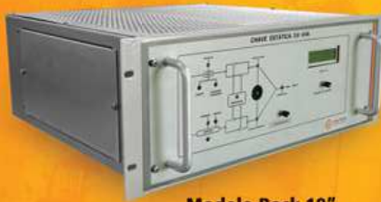
Modelo Rack 19"